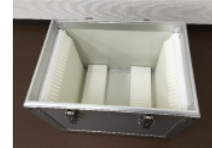
FPD用ガラス搬送ケース（アルミ製）

大正13年に創業し90年以上に渡りガラス加工及び周辺分野におけるベストパートナーとして最適なサービスを提供しています。精密・高品質なガラス搬送ケース製作・クリーンルーム洗浄から物流支援まで幅広く手掛けています。