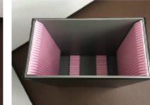
FPD用ガラス搬送ケース（プラ製）