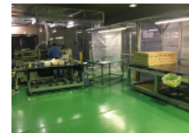
マルチサブライ事業 表面加工設備