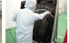
マスクケース洗浄（クリーンルーム）