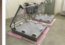
大型マスクケース（樹脂製）