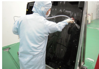
マスクケース洗浄（クリーンルーム）