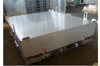
大型マスクケース（アルミ製）