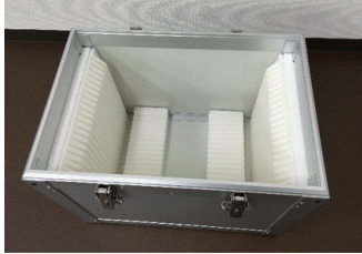
FPD用ガラス搬送ケース（アルミ製）

大正13年に創業し今年で95年を迎えました。長きにわたりガラス加工及び周辺分野におけるベストパートナーとして最適なサービスを提供しています。精密・高品質なガラス搬送ケース製作・クリーンルーム洗浄から物流支援まで幅広く手掛けています。