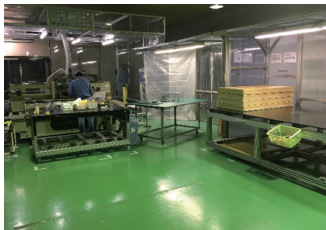
マルチサプライ事業 表面加工設備